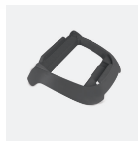
Socle pour boîtier de commande