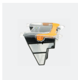
Bac filtrant (3 L) débris fins 100 microns