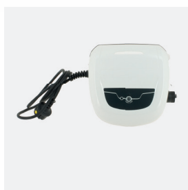
Boîtier de commande